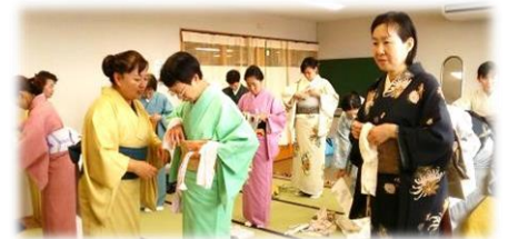
昨年(2016年)の研修風景