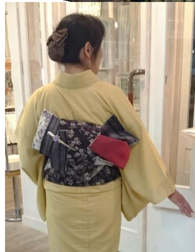
創作帯結び『夢あそび』

※抽選会でしみ抜き券が当たった方は、有効期限がありますのでお早めにご利用ください