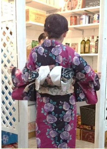
創作帯結び『蝉しくれ』

恒例の細帯の発表会やオークションでワイワイ盛り上がり、二次会には15名も参加してくれました！